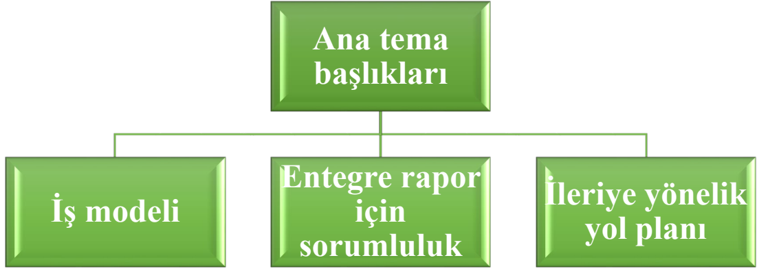
Şekil 1. Entegre Raporlama Çerçevesine İlişkin Revize Ana Temaları

Güncellenen entegre raporlama çerçevesinde belirlenmiş ana temalardan iş modeli ve entegre rapor için sorumluluk, doğrudan entegre raporlama çerçevesinde yapılacak değişikliğe yöneliktir. İleriye yönelik yol planı değişikliğinde ise; genişletilmiş güvence ve entegre raporlamada teknolojinin rolü gibi gelecek planlamasına yönelik konulara ilişkin paydaşlara sorular yöneltilerek daha çok kurumsal raporlamanın geleceğine ve IIRC'nin uzun vadeli stratejik planına odaklanılmıştır.